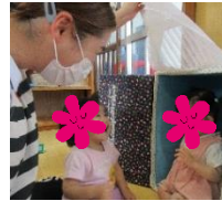
0, 1歳児 「いないいないばあ!」

室内での遊びが増えていきます。室内でも楽しく過ごせるようじっくり取り組める遊びや体を動かして遊べるよう工夫していきたいと思えます。