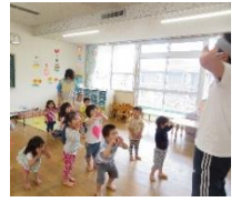
2歳児 「真似っこあそび」