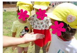
だんごむしのあしはなんぼん?