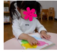
1歳児 「フィンガーペインティング」